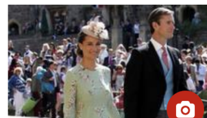
LEUTE VON HEUTE Pippa Middleton bestätigt