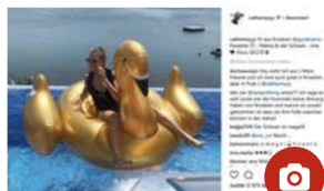
LEUTE VON HEUTE Goldener Schwan statt