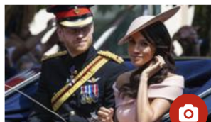
GEBURTSTAGSPARADE DER QUEEN Premiere für Meghan Markle,