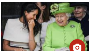
GEMEINSAME REISE Schöner lachen mit Meghan: